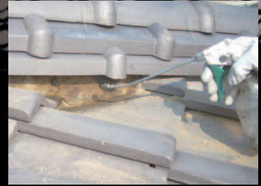
③ 下地処理 (場合により事前にプライマー処理)