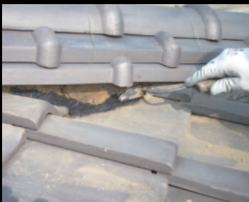
④ 下塗り (下部よりすり込むように塗り付けてください)