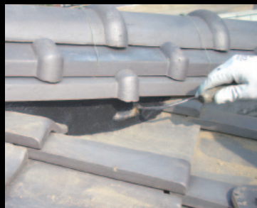
⑤ 表面処理 (半乾き後表面を良く整えてください)