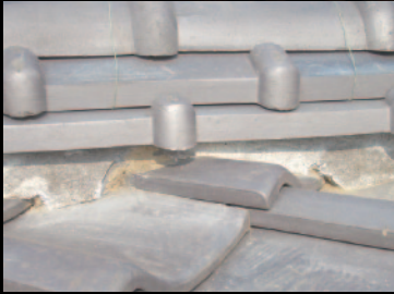
① 既存漆喰 (屋根漆喰がいたんでいます)